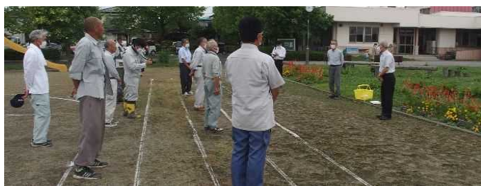
これまでの奉仕活動（今回で10回目）